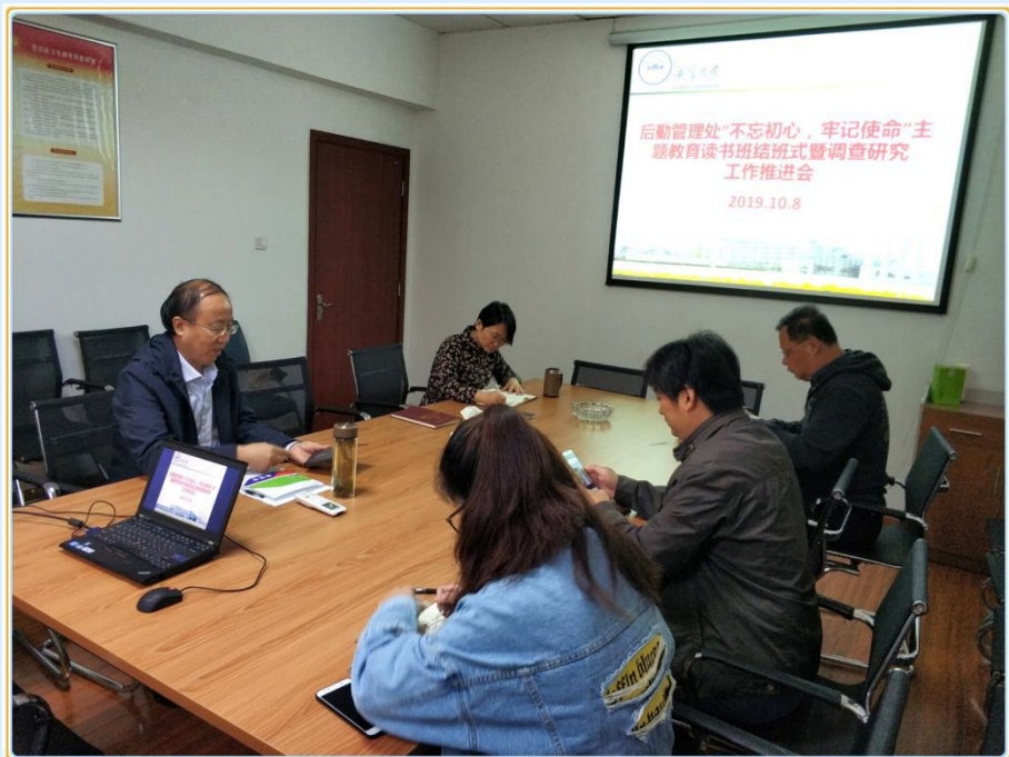
主题教育读书班结业式暨调查研究工作推进会会场

家通过读原著、学原文、悟原理，深刻领会了习近平新时代中国特色社会主义思想的核心要义、丰富内涵和实践意义，提高了用习近平新时代中国特色社会主义思想统领理论武装和实际工作的能力。三是提升了工作动力。大家认识到我们党的初心和理想、信念、宗旨、使命是紧紧联系在一起的，对“不忘初心、牢记使命”主题教育有了更加深刻的认识，提升了努力做好后勤工作的动力。郭子哨要求，处领导班子成员要率先垂范，推动后