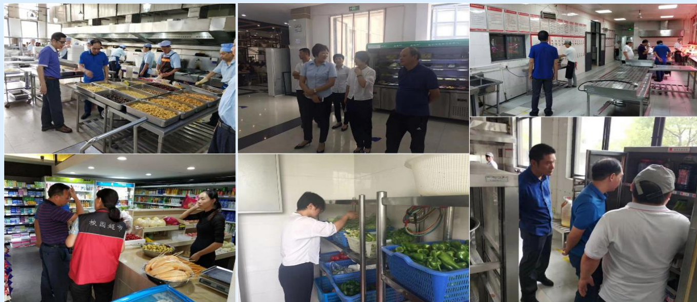
秋季食品安全专项检查现场

历时两天的食品安全专项检查，有效提高了食堂经营单位的食品安全意识，督促各食堂进一步重视和落实各项食品安全制度，降低学校的食品安全风险，达到了以查促建、以查促改的目的，确保了师生员工“舌尖上”的安全。★