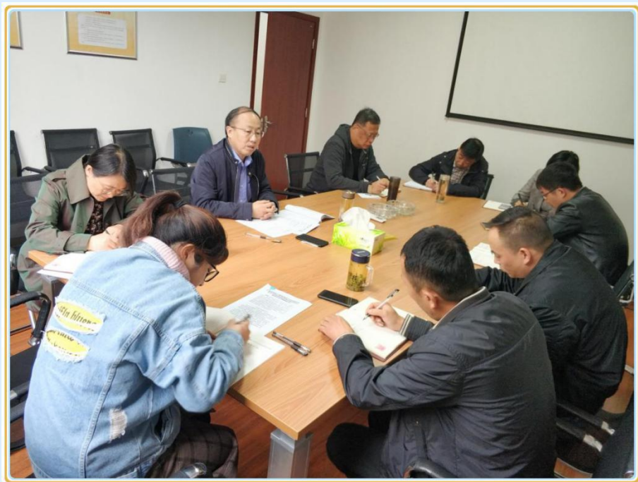
主题教育专题会暨座谈会会场