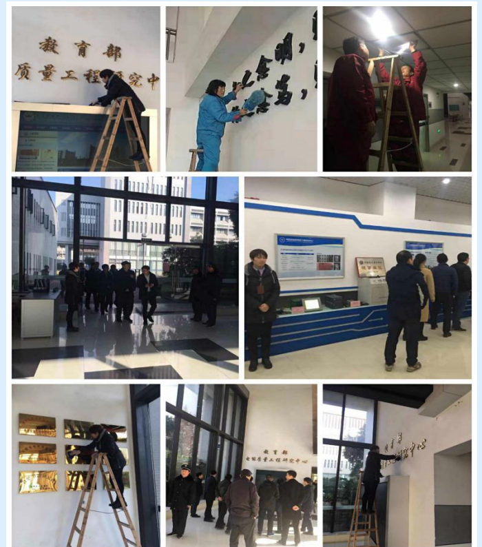
物业公司服务于实验室评估工作，促进学校“双一流”建设。