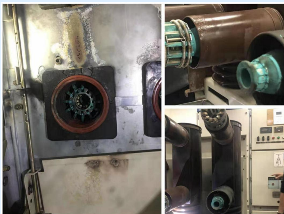
排查的安全隐患点图片

2019年10月14日凌晨，后勤服务中心动力部组织专业厂家和所属技术人员，实施了馨苑校区7号分开闭所高压开关柜设备检测维护工作。期间，成功发现该开闭所至馨苑宾馆高压出线开关存在放电、高压触头损坏、开关绝缘程度降低等重大安全隐患，随即采取了有针对性的处理措施。