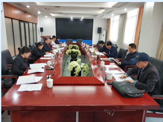
餐饮管理校长专题会会场

为了应对物价上涨、加强餐饮管理、维护师生员工切身利益，2019年11月13日上午，学校在磬苑校区办公楼B202会议室组织召开了餐饮管理校长专题会。纪检监察室、研究生院、学生处、采购管理中心、财务处、工会、后勤管理处、团委、后勤服务中心等部门负责人参加了会议。会议由校党委书记、副校长周飞主持。