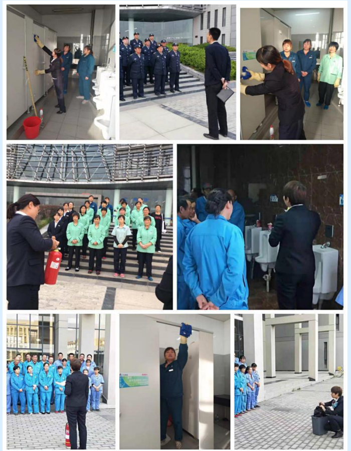
物业公司组织保安、保洁进行专业技能及灭火器使用方法培训，提升物业服务质量。