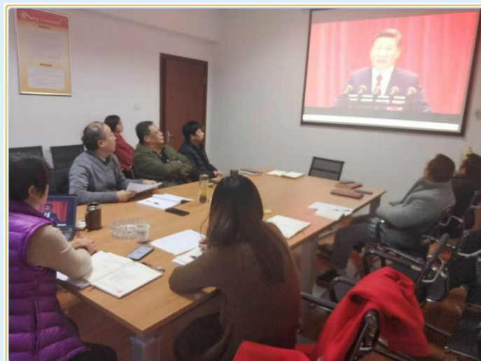
集中观看建国70周年成果展现场

进行评议。与此同时，开展了民主评议党员工作，全体党员按照“优秀”、“合格”、“基本合格”和“不合格”四个等次对后勤管理处每一名党员进行无记名投票测评，会议指派专人对测评表进行了汇总整理。