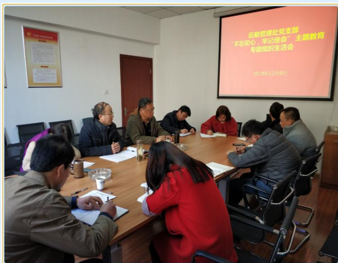
组织生活会暨集中学习会场