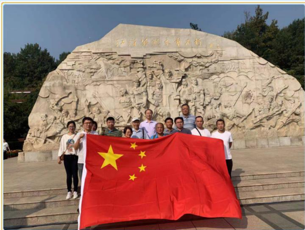
后勤管理处全体党员缅怀革命先烈