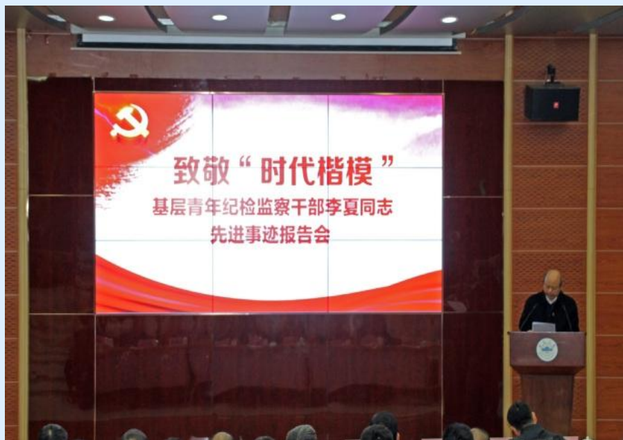
学习李夏先进事迹报告会现场

官”的作风。就是要学习他为干事创业而做“官”。真做事、做实事，就是李夏同志的真实写照，他给我们树立了榜样，也是衡量党我们性的重要尺度。面对前进道路上的矛盾和困难，他勇挑重担，为党分忧、为民解忧，摒弃私心杂念，把“怕”字变成“敢”字，敢于碰硬，敢于面对矛盾，敢于解决困难。我作为一名高校后勤管理干部，就要向李夏同志学习，在后勤实际工作中，保持咬定青山不放松的劲头，发扬“踏石留印、抓铁有痕”的精神，不被困难吓倒，不为挫折屈服，锲而不舍，顽强拼搏，协调处理好后勤保障供求关系，大力推进后勤改革，在改革中求发展。建立完善后勤保障标准体系和考核评价体系，强化制度建设与执行。在“不忘初心、牢记使命”主题教育中，广泛开展调查研究，深刻检视问题，制