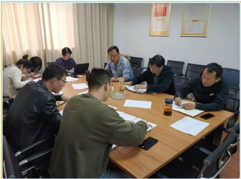
党代表选举和“两委”委员候选人推荐现场

会议最后，按照学校和机关党委印发的《关于做好中国共产党安徽大学第九次代表大会代表选举和“两委”委员候选人第一