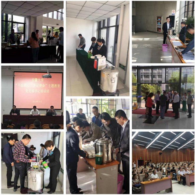
物业公司做好学校各类会议服务保障工作。