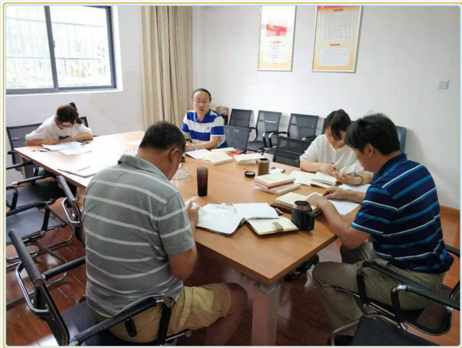
主题教育读书班开班式和集中学习现场