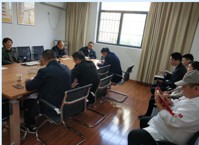
餐饮工作例会现场

运输、仓储、加工、售卖、留样等关键环节，与此同时，将其食堂消防安全管理，加强人员培训和应急演练，切实履行食品安全、消防安全主体责任。五是进一步提高对“面向采购”工作的认识，各食堂要克服困难，在原有工作的基础上，继续推进“面向采购”工作，进一步完善工作台账，继续实行信息报送制度和通报制度。六是将“不忘初心，牢记使命”主题教育与推进食品安全与评议物价暨“面向采购”工作结合起来，提高站位，查摆问题，推进整改，采取切实可行举措，进一步增强师生员工和食堂从业人员幸福感和获得感。★