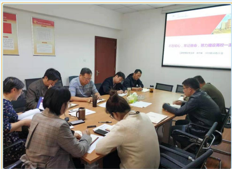
主题教育调研成果交流会和讲专题党课活动现场

党委组织部审定和批准的《后勤管理处“不忘初心，牢记使命”主题教育集中学习工作方案》，认真组织开展了“不忘初心，牢记使命”主题教育读书班，班子成员均参加了领学、自学和研讨活动，顺利完成了既定的主题教育读书班全部任务。领导班子成员成立专题调研组，直扑一线、直奔重点、直面难题，有序开展了专题调研并形成题为“关于我校后勤管理体制面临的挑战与对策措施研究”的主题教育调研报告。报告从我校后勤改革历程回顾、面临的新挑战与新问题、对策措施等三个方面全面梳理了此次调研成果，深入分析研究了我校后勤管理体制面临的挑战与对策措施。与会人员一致认为后勤管理处领导班子高度重视此次主题教育调研活动，认真制定方案和计划，细化工作措施，选题准确，调研内容实事求是，着眼查找自身问题和解决实际问题，进一步摸清了实情、分析了症结，研究提出了解决问题、改进工作的思路办法，真正做到问题清、