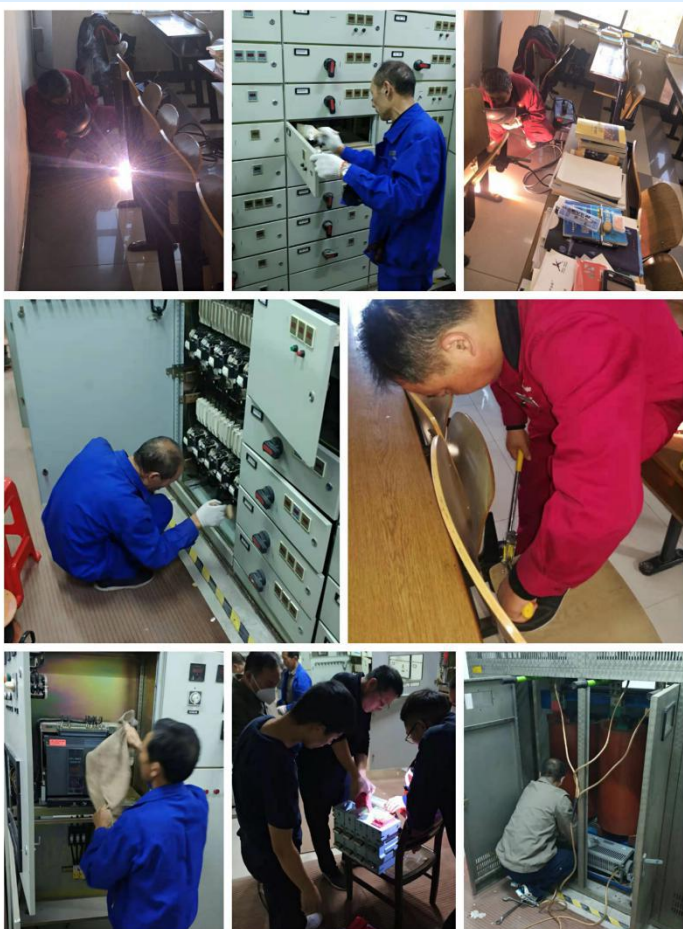
物业公司积极检查维修高压配电房配电设备、教室课桌椅等，保障学校各类考试顺利进行。