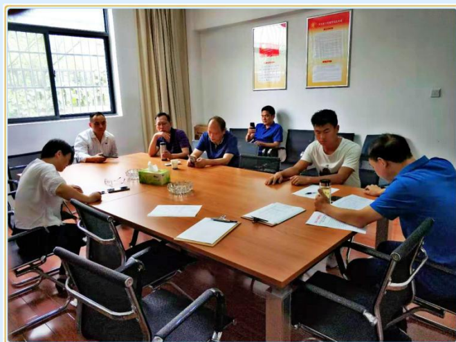
秋季食品安全专项检查培训会现场

各项规章制度、工作预案健全，食品原材料的索证、索票、台账记录已逐步规范，但个别食堂也存在留样管理不规范，冰柜管理不规范等现象；校园咖啡吧仍存在原材料存放和现场管理不规范等现象，检查组当场要求限期整改，各食品服务单位负责人表示要立行立改，以此次检查为契机进一步推进食品安全与卫生管理更上新台阶。下一步还将组织检查相关食品从业单位存在问题整改落实情况，举一反三，建立长效。