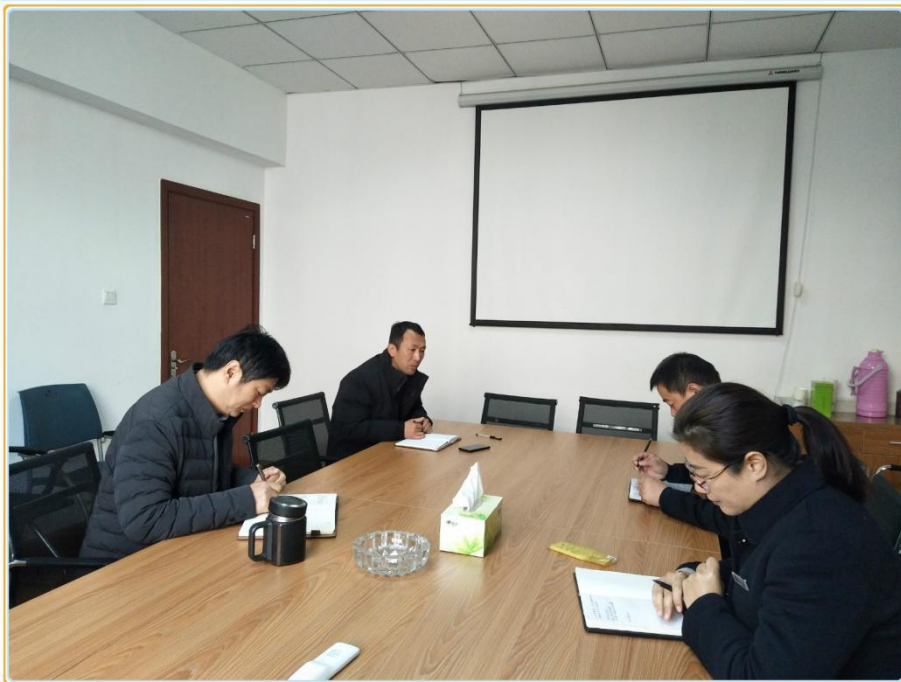
物业监管工作例会会场

会议研究部署了近期在馨苑 校区举办全国四、六级英语考 试、研究生入学考试、艺术类考 试等大型活动后勤服务保障工 作，提出了具体要求。一是各物 业公司须提前对校区内各考试教 室、楼道、卫生间等进行彻底的 清洁，彻查死角，保证考场的整 洁卫生。二是提前检查所有教室 的电源线路、照明设施等，发现 问题及时处理解决，确保考试使